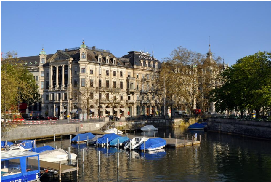
Schweizerische Nationalbank, Zürich